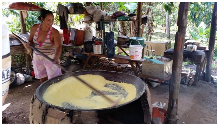
Figura N° 2 Residente preparando harina de mandioca ( Manihot esculenta Krantz)

La división de tareas entre hombres y mujeres según Amorozo (2008) es una práctica común en los países de América Latina. Sin embargo, se observó dos mujeres que viven en la comunidad realizando trabajo masculino como es limpiar terreno con azadón y sembrando yuca. Una colaboradora informante siembra, cultiva, cosecha y produce harina para su propio consumo (Figura N° 2). Según ella, fue su madre quien le enseñó a hacer varios tipos de harina, a saber, sabuiada, harina seca, harina para elaborar tapiocas y harina normal; ella ahora trata de transmitir ese conocimiento a sus hijas y hijos.