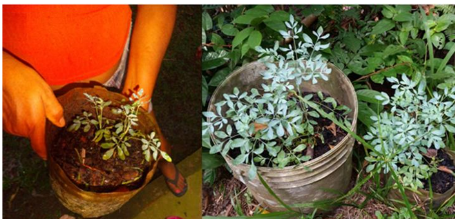
Figura N° 3 Especie Ruta graveolens L. cultivada en macetas

Algunas especies se cultivan colgadas en macetas, arriates, directamente en el suelo o en recipientes próximos de las casas en los patios, como es el caso de Ruta graveolens L. (la ruda) (Figura N° 3). El cultivo es hecho normalmente para satisfacer las necesidades terapéuticas de la familia. En el estudio de Gonçalves (2016) en una comunidad rural en Abaetetuba, la práctica de mantener los cultivos cerca de las casas tenía como finalidad facilitar el acceso puesto que las plantas a menudo se usaban en la preparación de alimentos y remedios. Según Siviero et al. (2012), en los patios del Amazonas plantas medicinales reciben un cuidado especial y se cultivan en lugares específicos.