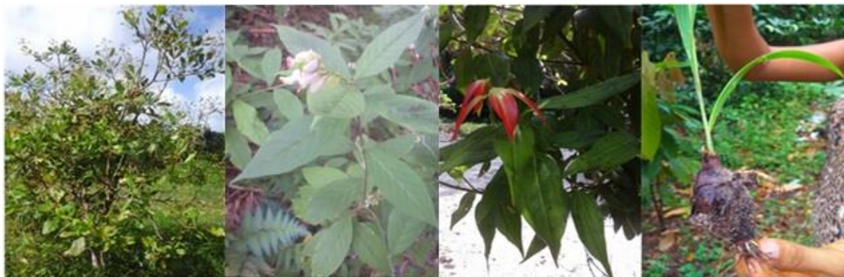
Figura N° 1

E. Bulbosa (Mill.) Urb conocida popularmente como marupaziño se usa en la medicina amazónica contra problemas de estómago (Leão et al. , 2007; Oliveira, 2016). En su composición química hay naftoquinonas, antraquinona y sapogenina esteroidea (Lorenzi y Matos, 2008).