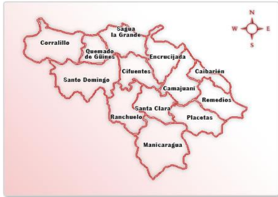
Figura 1. Mapa de las áreas objeto de estudio

Güines, Cifuentes, Sagua la Grande, Santa Clara, Manicaragua, Remedios, Caibarién y Camajuani (Figura 1).