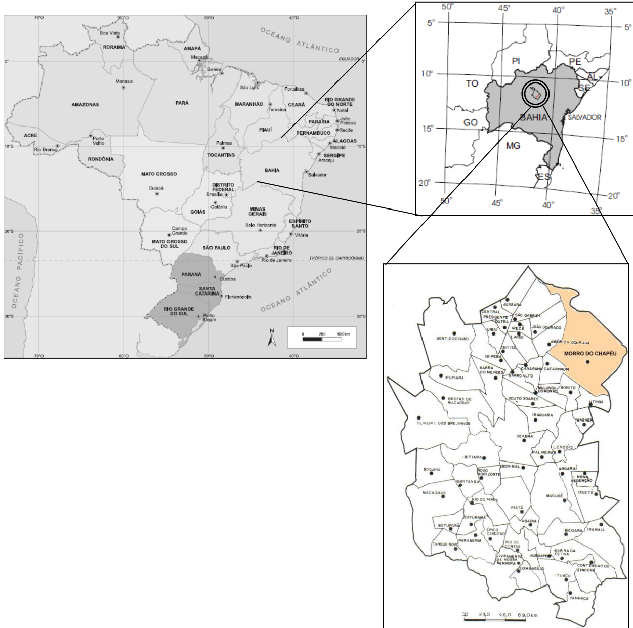
Figura 1 Localização da área de estudo.

A comunidade quilombola da Barra II está situada cerca de 13 km do Município de Morro do Chapéu e 330 km de Salvador (Bahia). (Figura 1).