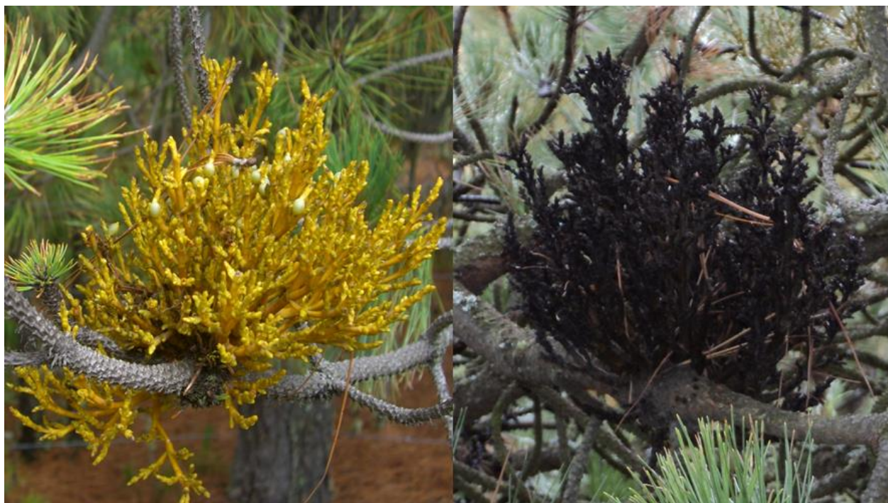
Figura N° 2 A. globosum (izquierda) y A. vaginatum (derecha)

clasificaran sus categorías de uso, bajo una perspectiva emic, y procedían a indicar el nombre común y con qué las asocian; posteriormente se registró la información general de las especies, así como la procedencia del conocimiento sobre las plantas; y la etapa fenológica de colecta (para corroborar la parte de la planta utilizada), apoyada en imágenes impresas en blanco y negro propuestas por Hawksworth y Wiens (1996). Los usos proporcionados por los entrevistados se agruparon, bajo una perspectiva etic, en dos categorías propuestas por Cook (1995): 1) Medicinal y 2) Lúdico.